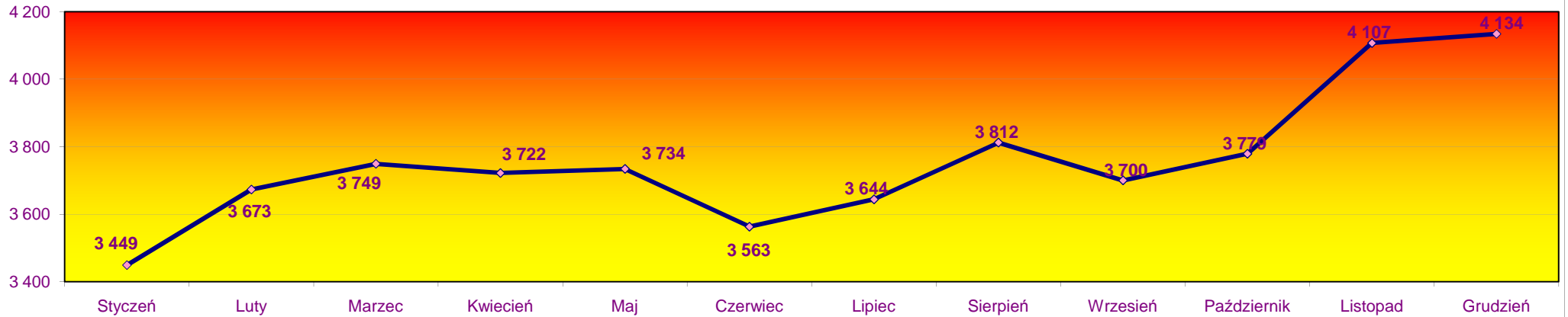
Stan bezrobotnych zarejestrowanych w 2009r. w mieście Opolu